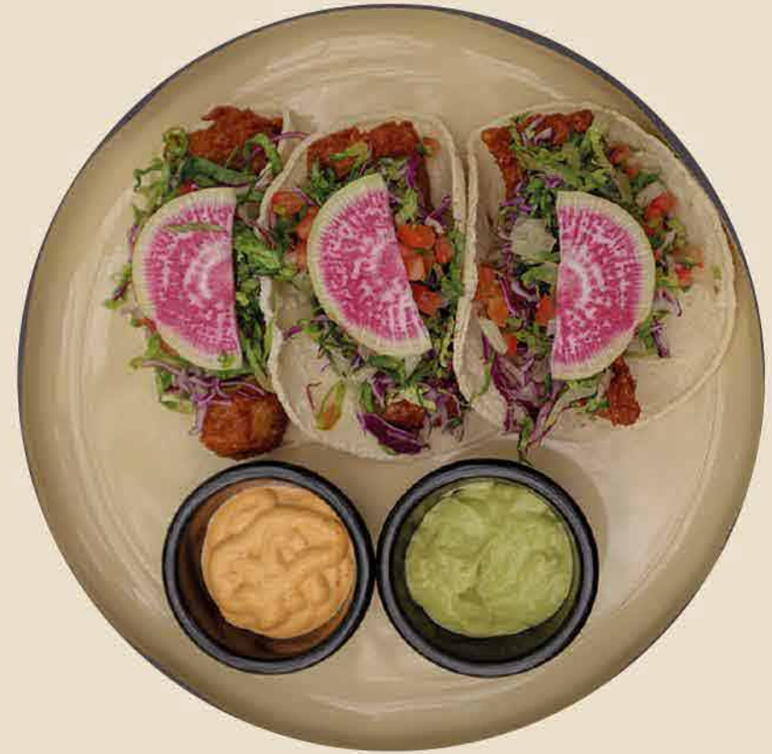
TACOS DE PESCADO FISH TACOS