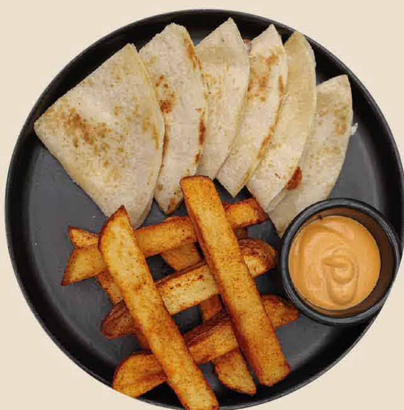
QUESADILLAS CON PAPAS QUESADILLAS WITH POTATOES