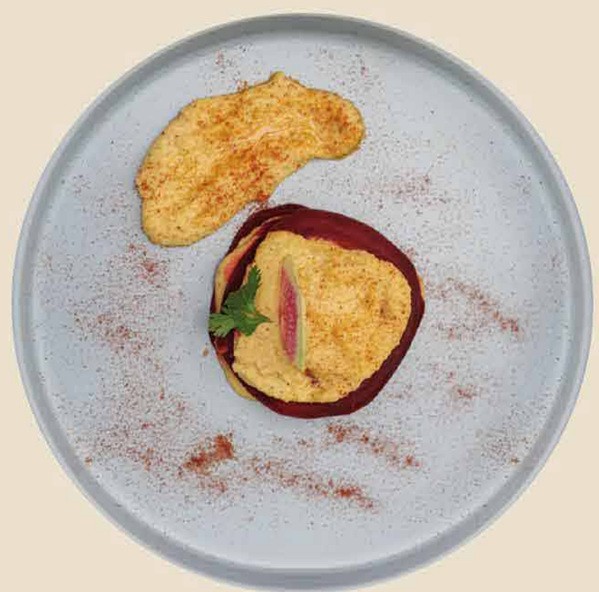
HUMMUS DE GARBANZO Y COLIFLOR CON BETABEL CHICKPEA HUMMUS AND CAULIFLOWER WITH BEETROOT