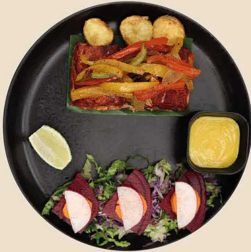
FILETE DE PESCADO FISH FILLET

DESSERT Artisan Ice Cream Season's Fruit